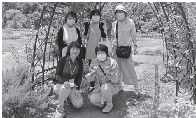
6月の家族介護者リフレッシュの会の様子

家族介護者リフレッシュの会は、在宅でご家族を介護されている方を対象として、介護者同士の情報交換、介護に関する相談、日帰り旅行などを通して、介護者の心身の負担を軽減することを目的として開催しています。 (信濃町委託事業)